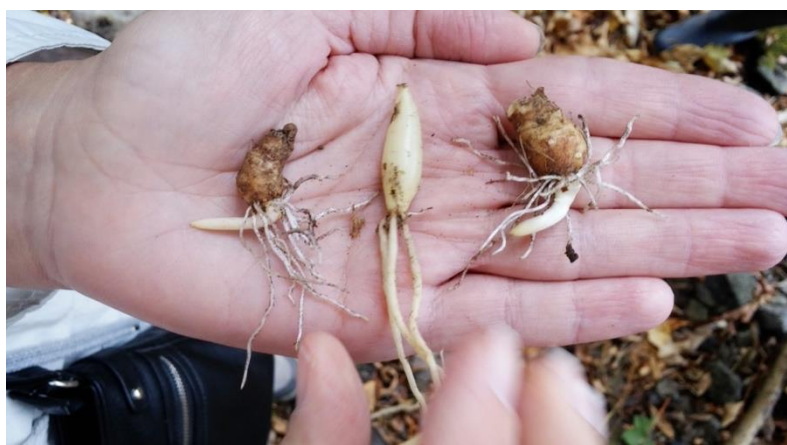
Tubercules de l'arum tacheté et bulbe de l'ail des ours (au centre).

Les parties souterraines se retrouvent également mêlées à celles de l'ail des ours et pourraient souffrir des mêmes confusions. Le tubercule de l'arum (ci-dessous aux extrémités) est oblong 17 et muni de nombreux filaments en alêne tandis que le bulbe de l'ail des ours est blanc et en fuseau (ci-dessous au milieu).