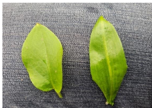
Confusion possible entre arum et ail des ours (à droite).

Les parties souterraines se retrouvent également mêlées à celles de l'ail des ours et pourraient souffrir des mêmes confusions. Le tubercule de l'arum (ci-dessous aux extrémités) est oblong 17 et muni de nombreux filaments en alêne tandis que le bulbe de l'ail des ours est blanc et en fuseau (ci-dessous au milieu).