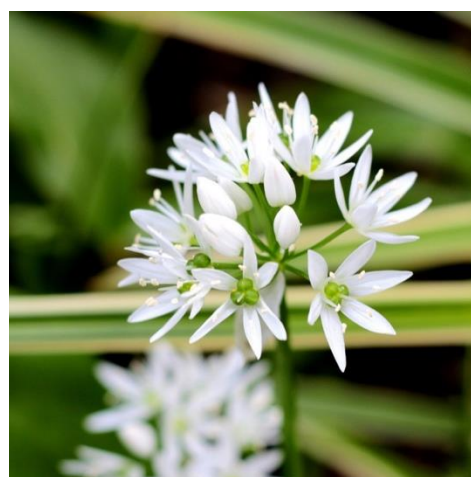
Fleurs de l'ail des ours.