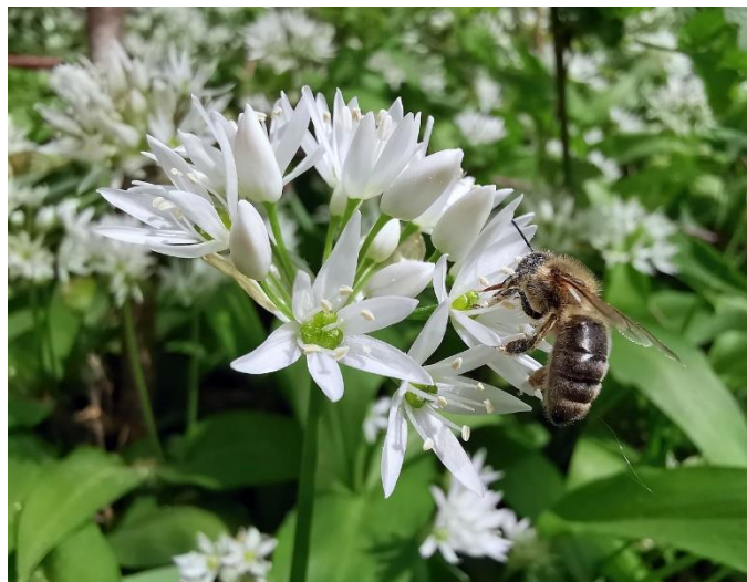
Intérêt mellifère.

On trouve de plus en plus de plants sur les étals. Si vous les prélevez malgré tout en forêt, respectez la loi et soyez particulièrement modéré dans vos prélèvements !