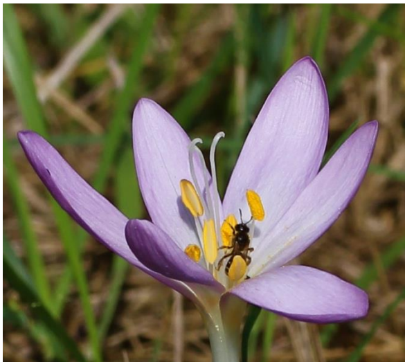
Fleurs du colchique.

Il renferme de la colchicine qui est un très puissant alcaloïde.