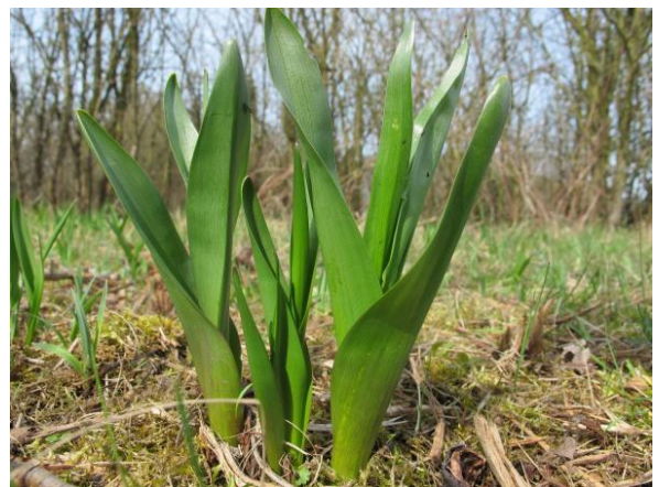
Feuilles du colchique.