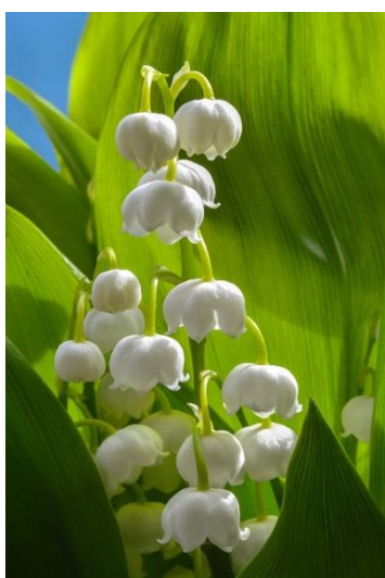
Fleurs du muguet.

La distinction se fait beaucoup plus aisément lorsque les plantes sont en fleurs : la fleur de muguet est en forme de clochette et celles de l'ail des ours sont en forme d'étoile, disposées en ombelle.